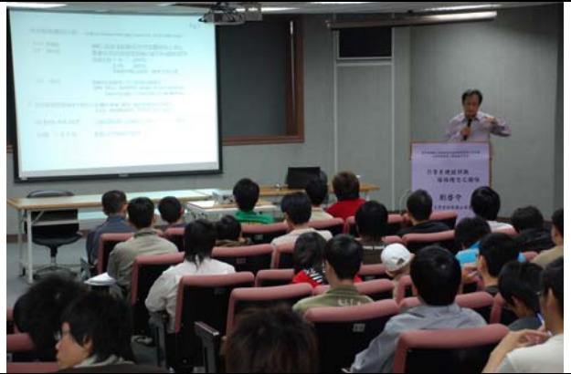
演講主題引擎系統設計與環保理念之關係