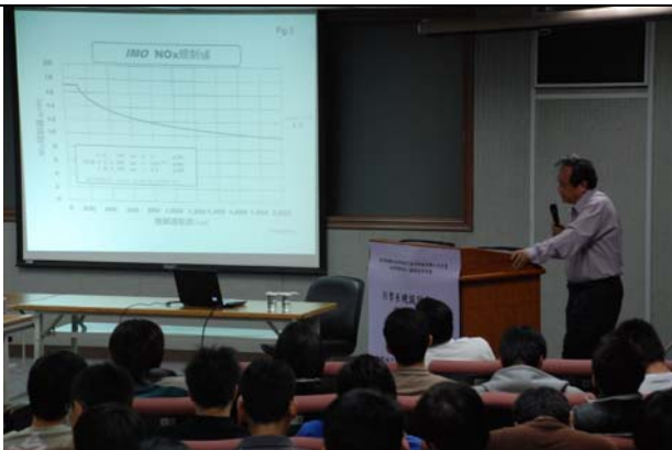
說明 IMO 對內燃機排放出之氮氧化物(NOx)之容許率