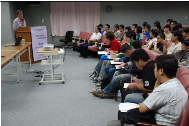
說明現今之引擎設計必需注意事項