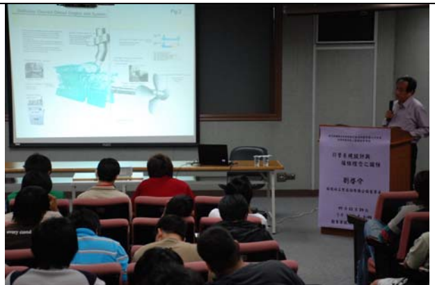
介紹內燃機及周邊設備之應用設計