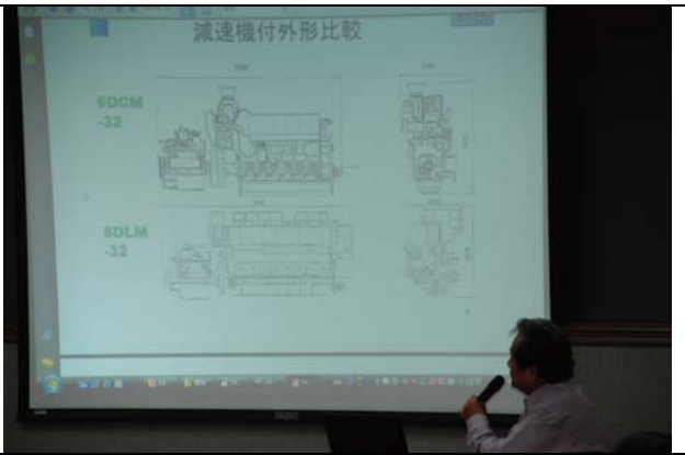
減速機外形的比較