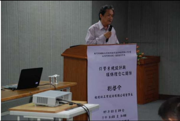
演講者—船技社工業股份有限公司董事長