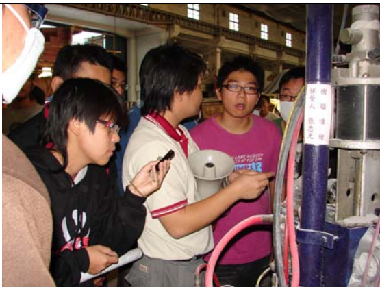
解說樹脂噴槍之用途