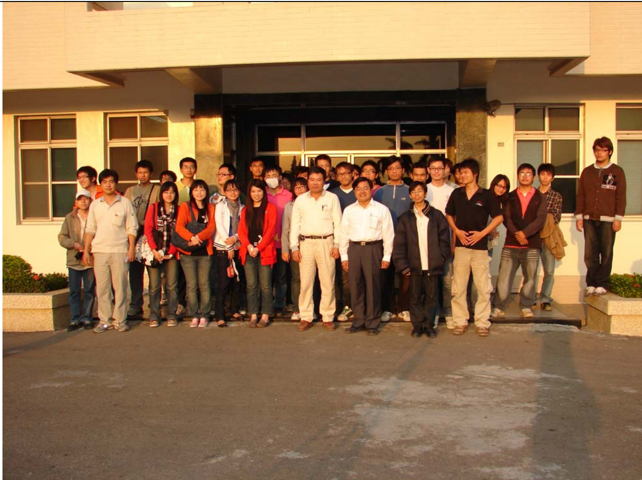
聯華實業股份有限公司高雄遊艇廠