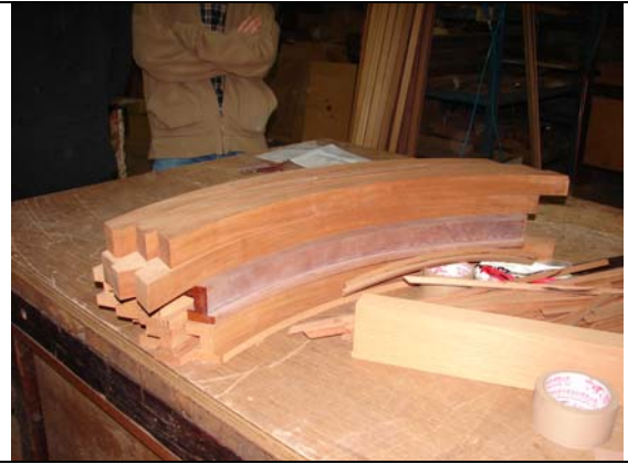
有弧度之木工配件均是由木片一片一片堆疊而成