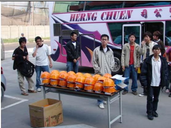
先進複材貼心的接待－工程帽及口罩