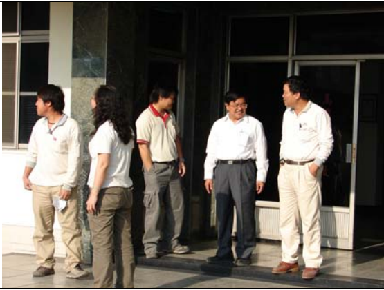
聯華實業高雄遊艇廠廠長及解說團隊