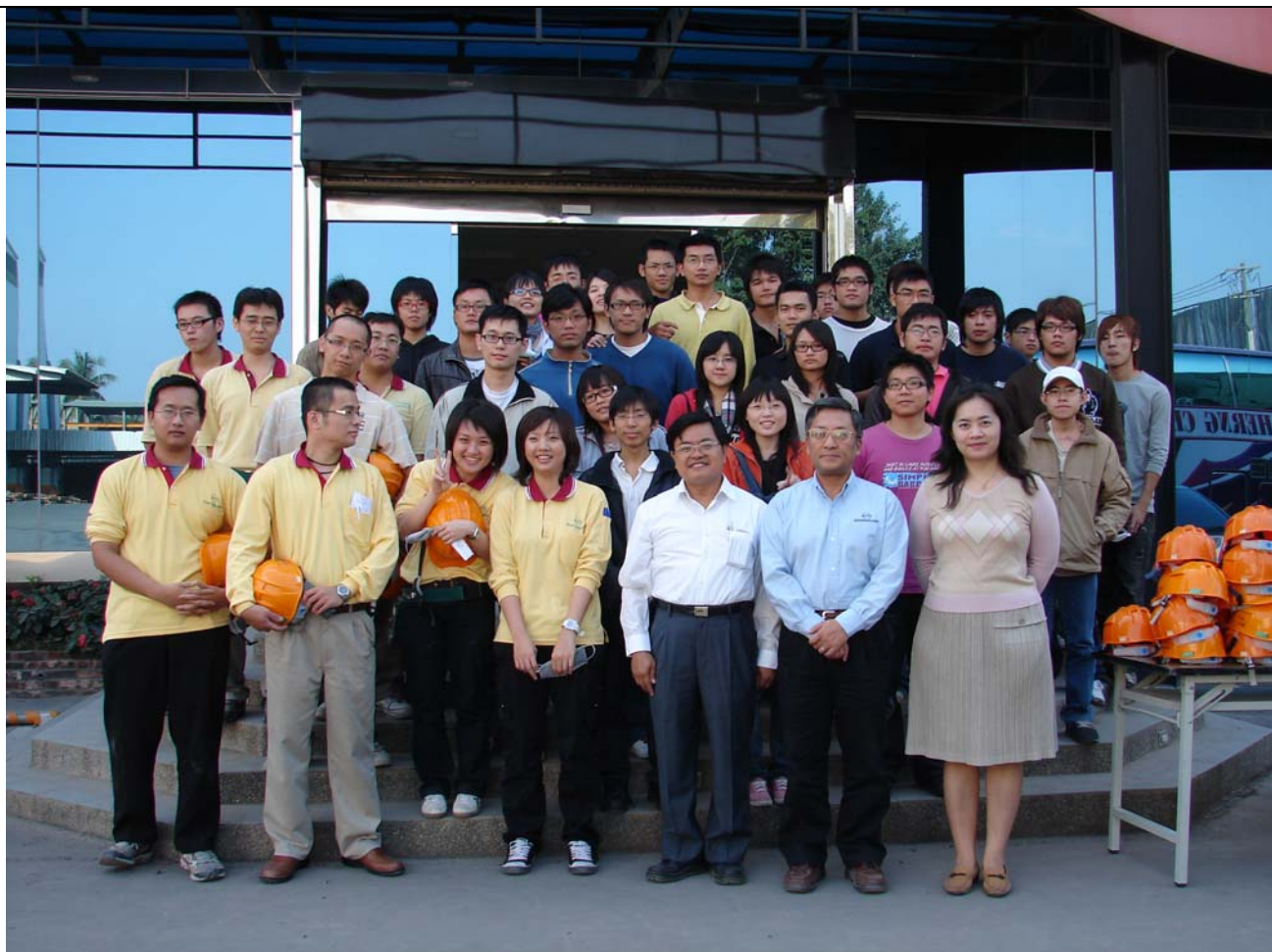
與先進複材科技股份有限公司解說團隊合照