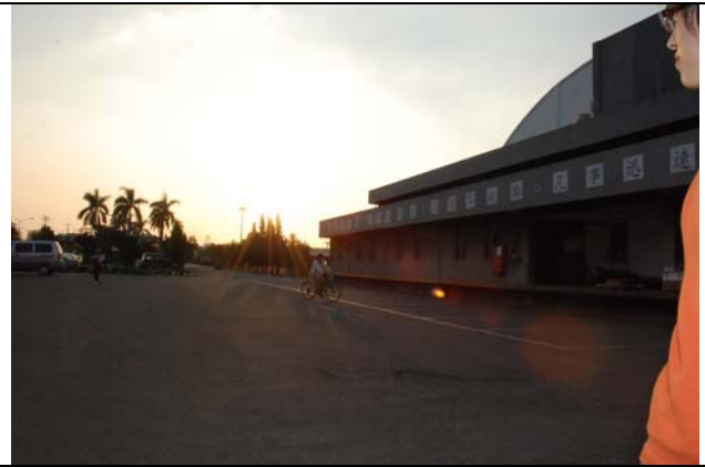
本學期船廠參訪正式結束